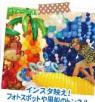
インスタ映え! フォトスポットや風船のトンネル