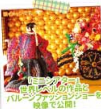
『ミニシアター!』世界レベルの作品とバルーンファッションショーを映像で公開!