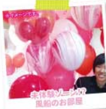
来体験ゾーン! 風船のお部屋